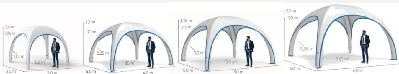
XC 3 x 3 m